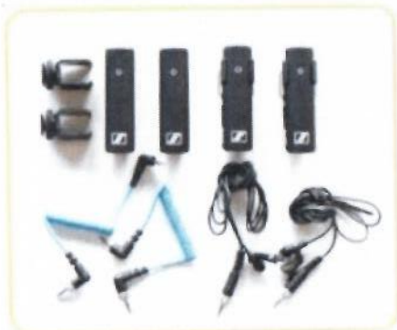
радиосистемы с петличными микрофонами (x2)