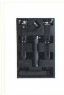
Комплект для второго калма для Barin RS2