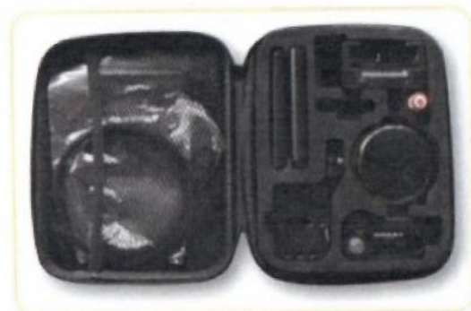
системы удаленного управления фокусом камеры (x2)