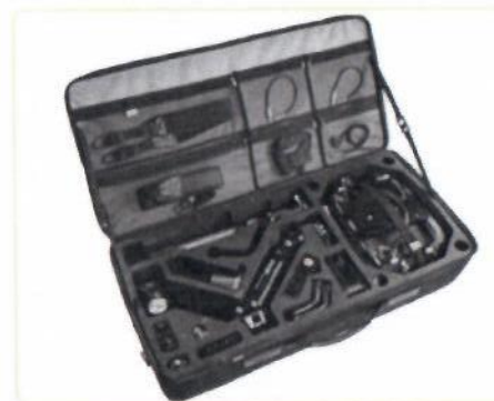
Комплект разгрузки для стабилизатора Barin RS2 - Титан Флайт