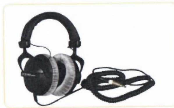
студийные наушники для мониторинга звука при записи (x2)