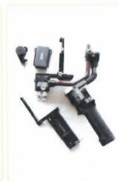
Стабилизатор Barin RS2