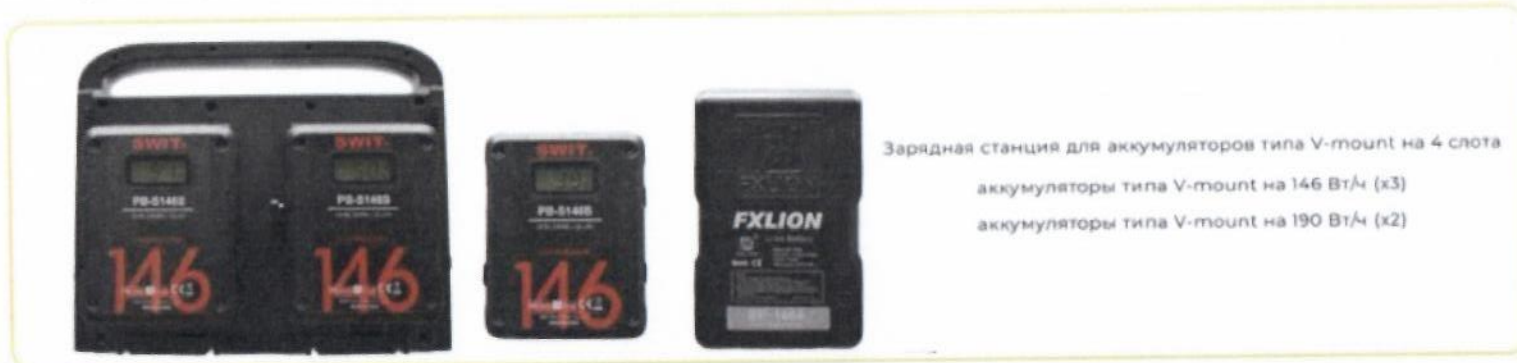
Зарядная станция для аккумуляторов типа V-mount на 4 слота