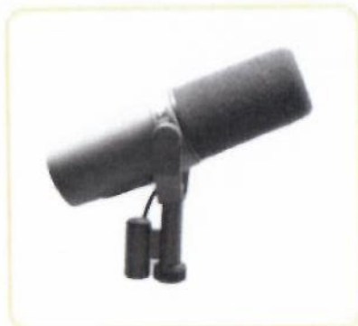
Студийный микрофон для записи подкастов